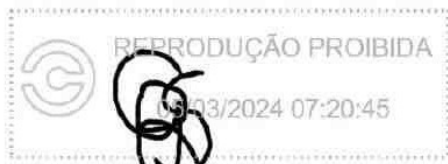
GUNTHER SINDER RODRIGUES 05 mar 2024, 07-20-45.png

Assinatura manuscrita com hash SHA256 prefixo 5e9d72(...)